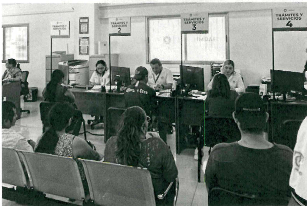
Dirección de Ventanilla Única de Trámites y Servicios